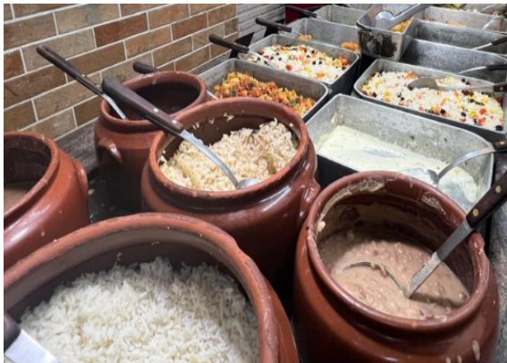
左：フェイジョアーダ

次に代表的料理であるフェイジョアーダは、植民地時代アフリカから奴隷として連れてこられた人々が、主人が食べ残した豚の耳や足などの部位を黒豆とともに煮込み作っていた料理と言われています。大量のニンニクで長時間煮込みますので、かなり癖の強い味ですが、一度ハマると抜け出せません。